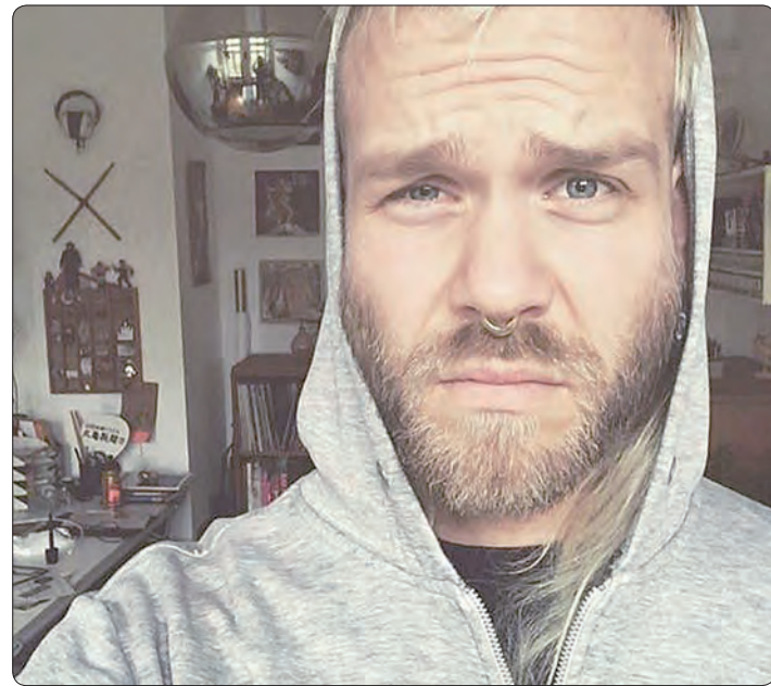
Der Leipziger Künstler „Mont Blond“ entwarf das Motiv.