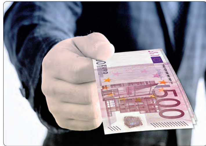
Für Pflegekräfte soll es bis zu 1500 Euro Bonus geben.