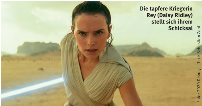
Die tapfere Kriegerin Rey (Daisy Ridley) stellt sich ihrem Schicksal