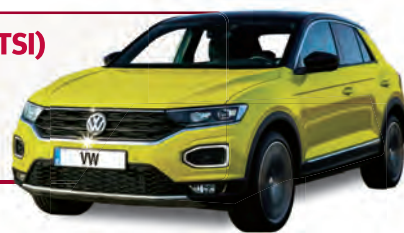
Alle Auto-Abbildungen ähnlich

Am Telefon die Durchwahl: 24 oder per SMS: rtv24