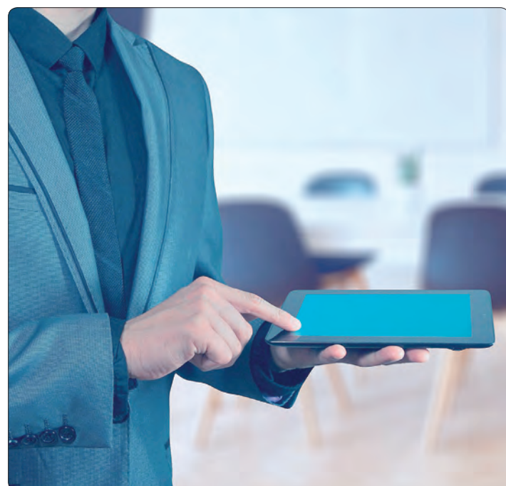
Die Allianz bietet Firmenkunden Hilfe in der Coronakrise an.

Hat ein Betrieb einen Vertrag mit Öffnungsklausel abgeschlossen und ist neben der Vollschießung auch die Teilschließung eingeschlossen, was zumeist bei Krankenhäusern der Fall ist, ist das Coronavirus mitversichert. Der Schaden wird dann im Rahmen und Umfang der Versicherung reguliert. pm