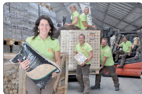
Das Team der Hainichener Firma Naturbrennstoffe ist auch in Corona-Zeiten im Einsatz.

Der Monatswechsel mit Schnee und Temperaturen unter null Grad hat es gezeigt: Brennstoffe werden auch weiterhin benötigt. Die Hainichener Firma „Naturbrennstoffe Kretschmann OHG“ ist die richtige Anlaufstelle, wenn es um Holzbriketts, Holzpellets, Kaminholz oder Tierreinstreu geht. Das Verkaufslager in der Friedrich-Gottlob-Keller-Siedlung 27a in Hainichen ist wochentags von 8 bis 17 Uhr und samstags von 9 bis 12 Uhr geöffnet.