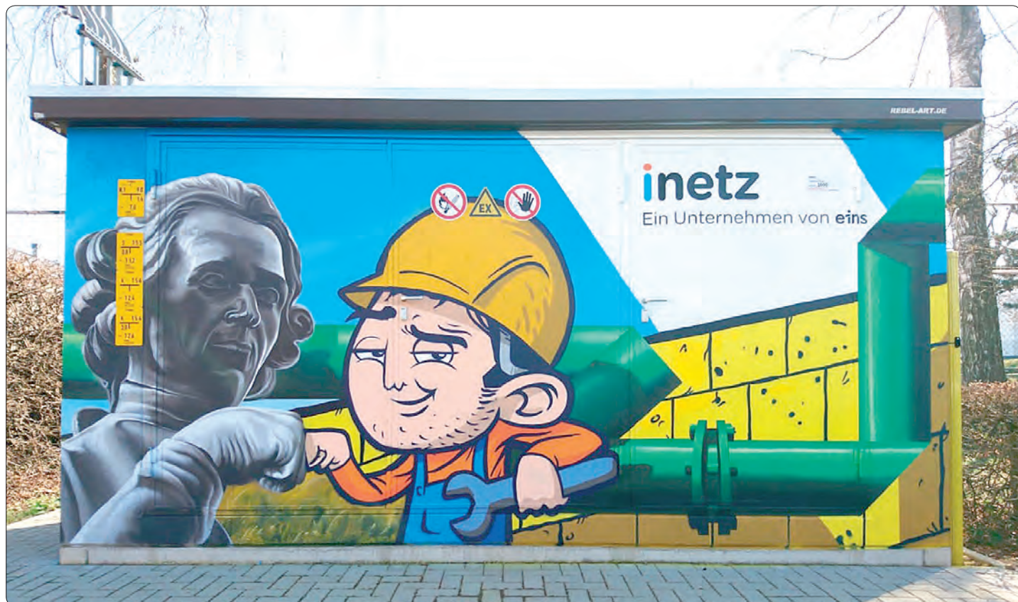
Eine tolle Bemalung hat der Verteilerkasten an der Ecke Heinrich-Heine-Straße/ Gerichts-Straße in den vergangenen Tagen erhalten.

Ahornstr. 2 | 09661 Hainichen | Telefon 037207 5600 Neusorger Str. 34 | 09648 Altmittweida | Tel. 03727 94300