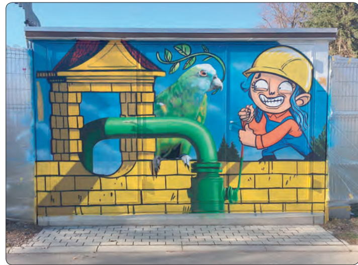
So sieht das Stromhäuschen an der Ziegelstraße aus.

Kreativagentur und Netzwerk macht Hainichen ein wenig bunter