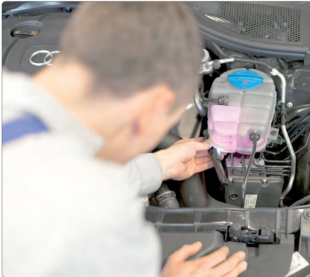
Kfz-Werkstätten sind weiter für ihre Kunden geöffnet.

Ist es ein triftiger Grund, die Kfz-Werkstatt zu besuchen?