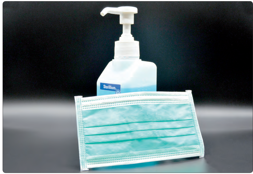
Für Pflegebetriebe in Mittelsachsen gabe es jetzt Desinfektionsmittel und Schutzmasken.

Wir sind immer für Sie telefonisch erreichbar. Persönliche Gesprächstermine nach Vereinbarung.