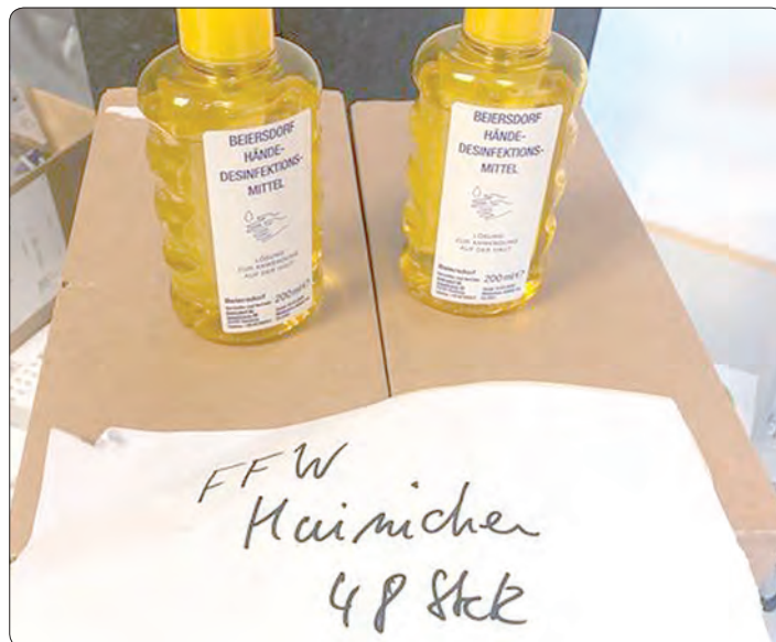
Desinfektionsmittel für die Feuerwehr Hainichen aus Waldheim.

Mehr zu Hilfsaktionen für Pflegekräfte der Firma Beiersdorf lesen Sie auf Seite 8