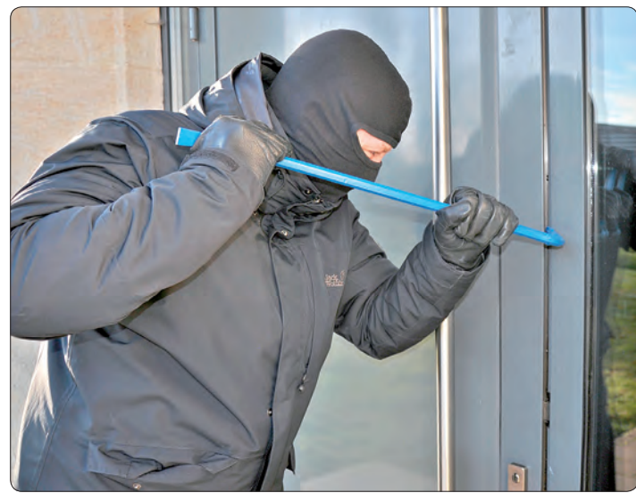
Die neuen Zahlen der Kriminalstatistik zeigen: Mittelsachsen ist eine sichere Region. Trotzdem gibt es täglich 32 Taten bei denen unglaubliche 24.383 Euro Schaden angerichtet werden.

Jeden Tag passieren 32 Straftaten, bei denen 24.283 Euro Schaden entstehen!